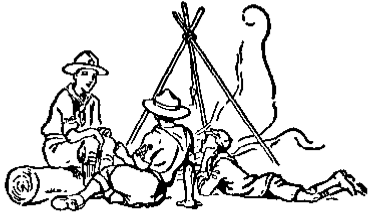
Miembros de la familia Scout: Lobato, Scout y Rover Scout.

El primer paso que se debe dar para el éxito en el adiestramiento de un scout es tratar de conocer algo de la vida de los muchachos en general y luego la de éste en particular.