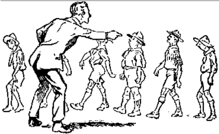
El muchacho que demuestra iniciativa es el que será elegido para recibir la distinción.

En esta época se nota, como siempre se ha notado, un desperdicio lamentable de recursos humanos. Esto se debe principalmente a los errores de adiestramiento. A la mayor parte de la juventud no se le inspira el amor al trabajo. Aun cuando a los muchachos se les enseñan oficios o métodos mercantiles, y se desarrollan en ellos las cualidades necesarias para el éxito en diversas profesiones raramente se les muestra la forma en que pueden emplear su habilidad con el fin de forjarSe una carrera, ni se enciende en ellos la llama de las ambiciones nobles y elevadas. Por eso, con demasiada frecuencia encontramos clavijas cuadradas en agujeros redondos.