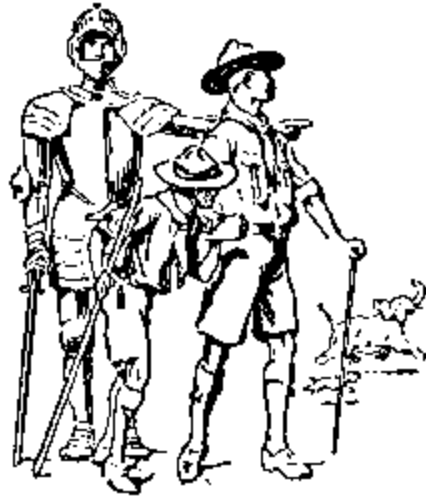
El Jefe de Tropa guía al muchacho con el espíritu de un hermano mayor.

Como palabra preliminar de aliento para los que aspiran a ser Jefes de tropa, quisiera desvanecer el concepto errado que usualmente se tiene sobre que, para llegar a lucirse como Jefe de Tropa, el individuo debe ser émulo del admirable caballero Crichton, es decir, ser sabio... No hay tal cosa.